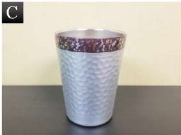
▲ C. ステンレスタンブラー