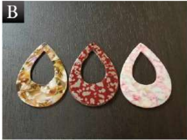
▲ B. ペンダントトップ