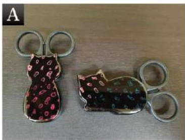
▲ A. マグネット付 猫型ミニはさみ