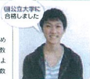
国立大学に 合格しました

めばえ教室の体験コーナーで触れた教材を毎日通いつめて遊ぶほど嬉しく入り、本人の希望で入室しました。教室に通っているうちに、何ごとにも根気よく取り組めるようになり、協調性もしっかり身につけてきました。少人数制なので、生徒一人ひとりの個性を大切にしてください、よい所を伸ばしてくれるところが気に入っています。