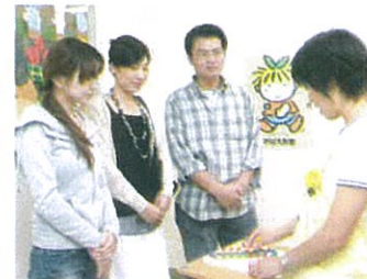
授業終了後にその日の内容をご説明いたします