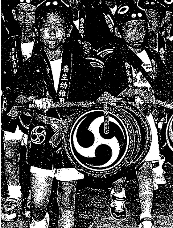
「広報 ひろさき」NO.397 グラフ特集弘前ねぶたまつり (2022年5月、玉川作成資料より)