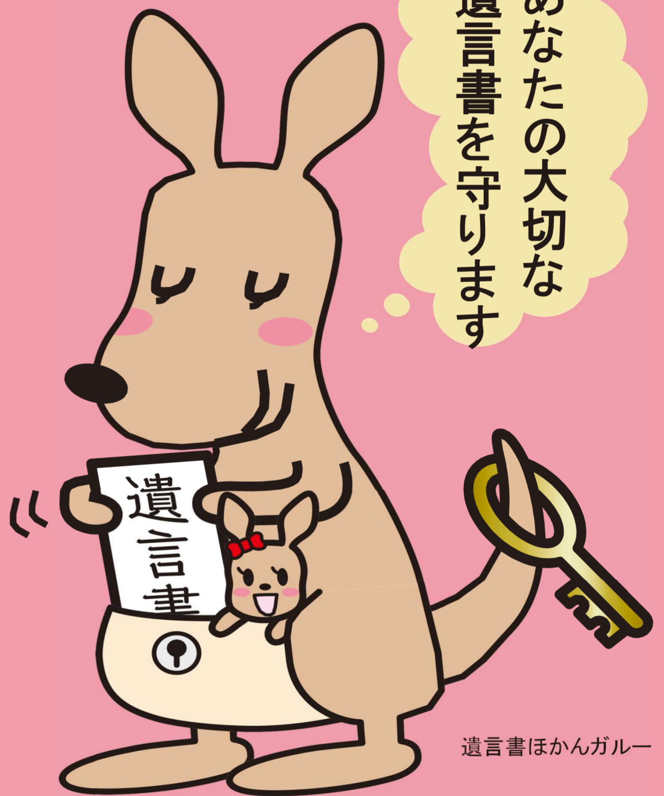
遺言書ほかんガルー