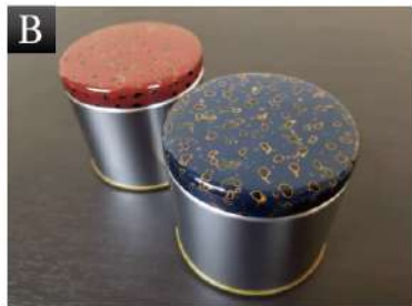
▲ミニキャニスター缶