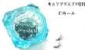
セルフマツエク専用 グルー