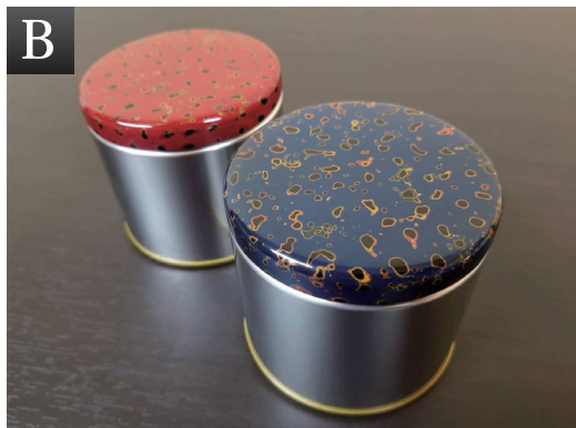
▲ミニキャニスター缶