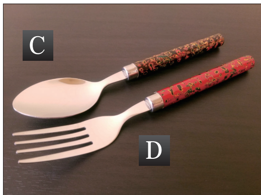
▲C. スプーン、D. フォーク