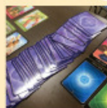
○ カードリーディング