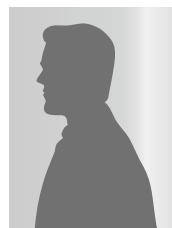
H.Nさん (60代) 軽度の肝硬変 2500万円受給

20代で献血をしてキャリアと判明、その後慢性肝炎に。50代で肝硬変を発症。 H25.5 当事務所の相談会にて相談 H25.7 契約 H26.7 給付金受給